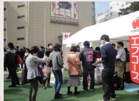
★ラブエフエム国際放送主催 LoveFM