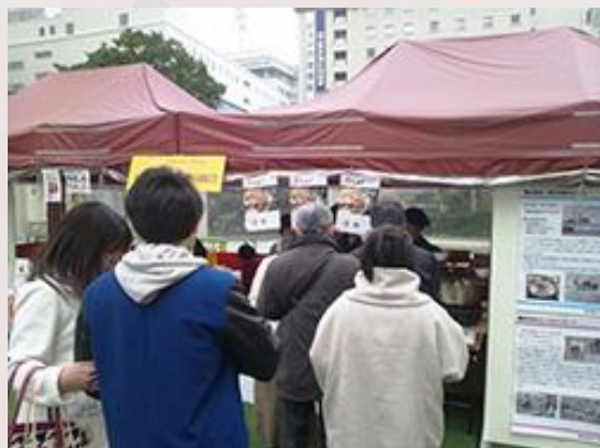
★西日本新聞社主催 Smile!FukuokatoTohoku FESTIVAL