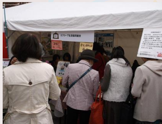
★福岡県主催 ふくおかできるマーケット