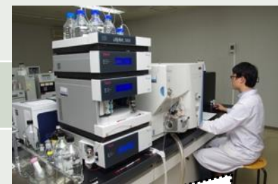
エフコープ商品検査センターの様子（一例）