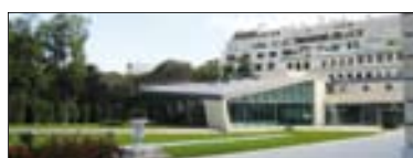
Siège de l'OCDE (à gauche) et son centre de conférences (ci-dessus). Siège de l'AEN (à droite).