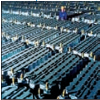
Exemples d'activités de démantèlement menées au Royaume-Uni.