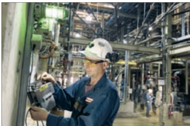
Contrôles radiologiques. Ci-dessus : à McClean Lake, Canada. Ci-contre : à Saclay, France.